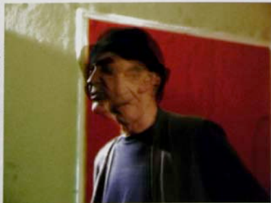
מחול המופע במסגרת תערוכת האמנות, 2003

התחום השלישי של הצילום האמנותי המודרני הוא הצילום הישיר. "הסתם צילום", לא כזה מסונגן, שמכוון למודע או לתת-מודע, ולא אמנות טעונה שהאופת לצאת מנבולות הצילום לשמו. לכאורה, צילום ללא מטרה, דווקא לצילום מסוג זה יש לעתים קרובות קסם רב, משום שאין בו שום כפייה, משל אומר האמן "הסתכל על העבודה ומצא בה